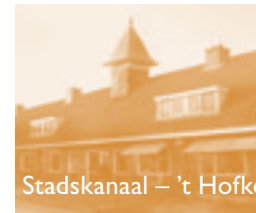
Stadskanaal – 't Hofke