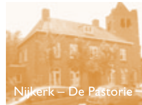
Nijkerk – De Pastorie